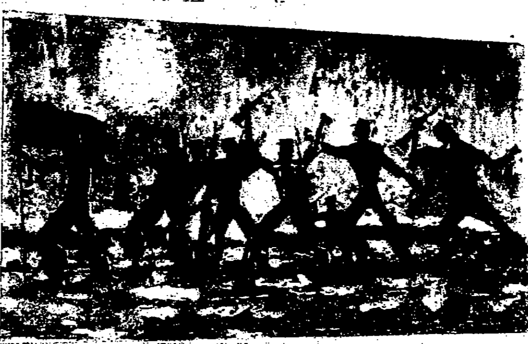
انتم في جميع لوحاته ، رغم توغها ، بالثقة والوضوح برغم ان بعضها ، كان يبدو عليه طابع القفزة التي تهب من تحتها ، للتسلسل في اسلوب قسبي خاص .